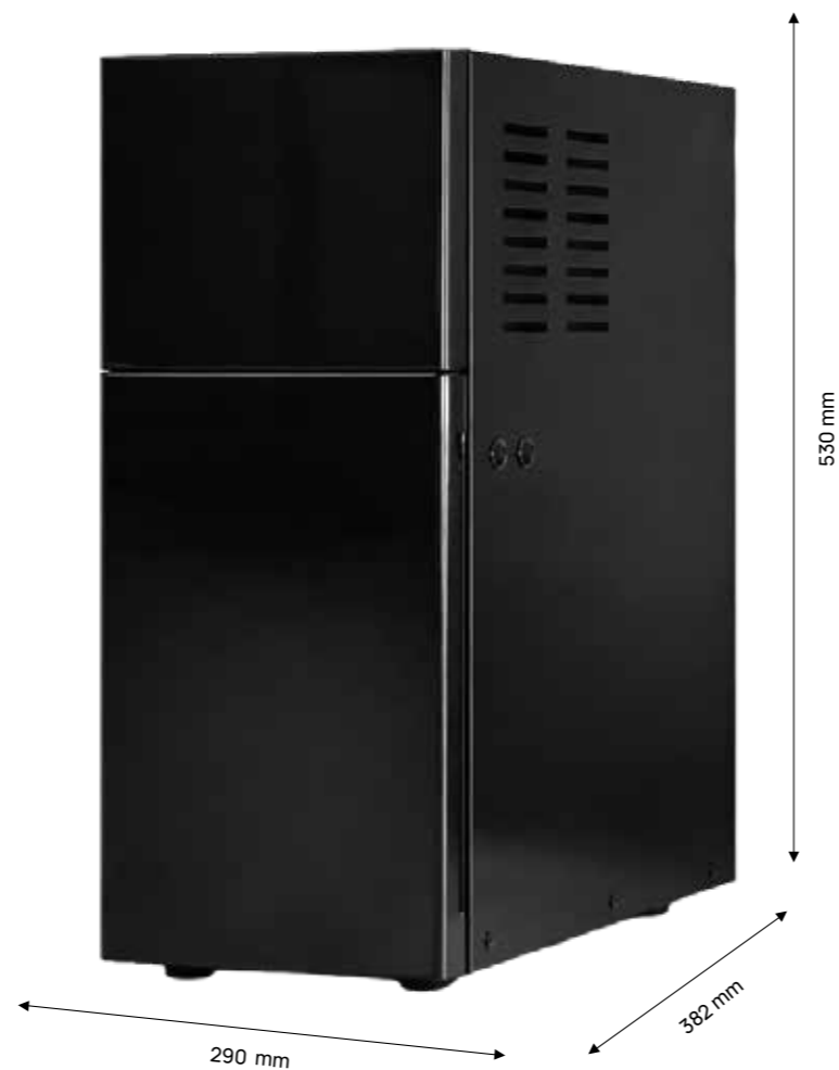
Vakiomallinen maitojääkaappi / 7 litraa